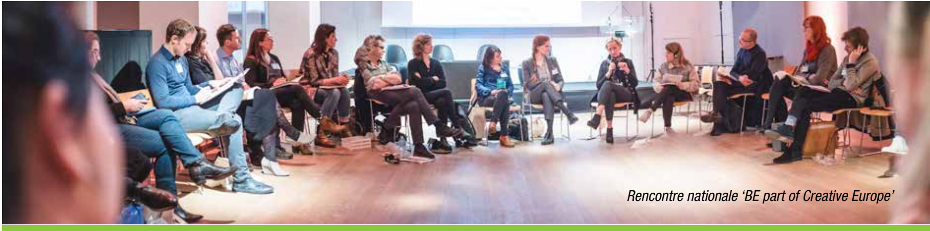
Rencontre nationale ‘BE part of Creative Europe’