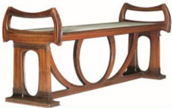
Gustave SERRURIER-BOVY, banquette du piano présenté au Grand Curtius

Du 1 er juillet au 30 septembre 2018, les biens culturels repris dans ce dépliant seront également valorisés au sein des écrans que constituent les musées qui les conservent.