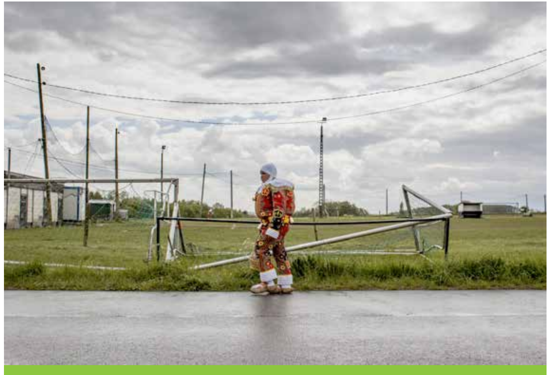
Lauréat du concours photo