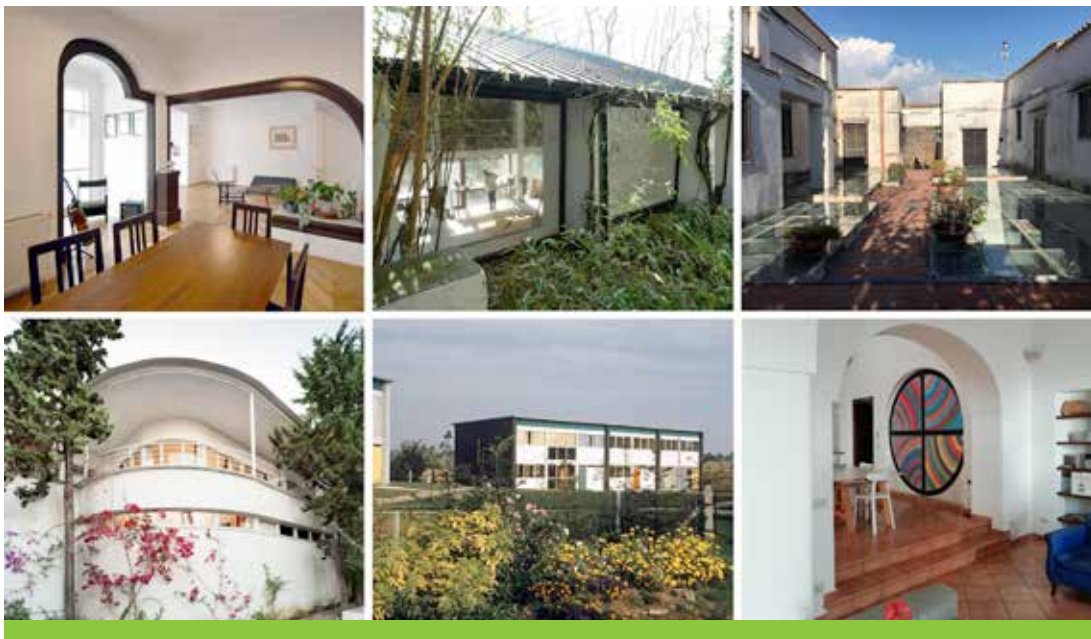
Maisons sélectionnées dans le cadre de «Artists in Architecture»

En outre, en 2018, l'Union européenne a financé par l'intermédiaire de ses programmes de financement une série des projets en faveur du patrimoine culturel. Ainsi, dans le cadre du programme Europe créative, un appel spécifique pour des projets de coopération a permis de financer, à concurrence de 5 millions d'euros, 29 projets transnationaux destinés à promouvoir le patrimoine culturel. Le programme Horizon 2020 a, quant à lui, investi 66 millions d'euros dans des projets de recherche et d'innovation liés au patrimoine culturel. D'autres subventions étaient également disponibles par l'intermédiaire d'Erasmus+, de l'Europe pour les citoyens et des fonds structurels européens.