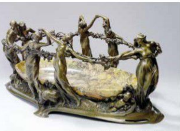
Egide ROMBAUX, Les filles du Rhin , Musée Horta

Du 1 er janvier au 31 mars 2018, les biens culturels repris dans ce dépliant seront également valorisés au sein des écrins que constituent les musées qui les conservent.