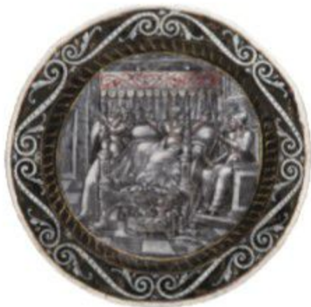
Jean MIETTE, La naissance d'Hercule , assiette émaillée, Limoges, milieu du XVI e siècle, TreMa, Namur

Du 1 er octobre au 31 décembre 2018, les biens culturels repris dans ce dépliant seront également valorisés au sein des écrans que constituent les musées qui les conservent.